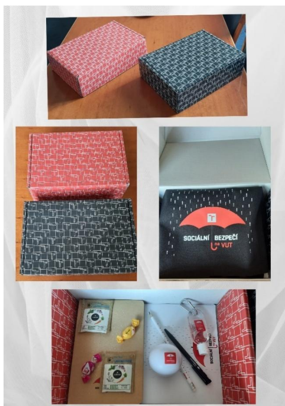
KPZ terénní box

„KPZ terénní box“ byl vytvořen na základě potřeb kontaktních a spolupracujících osob. Obsahuje vše nezbytné pro jejich práci: základní dokumenty, zápisník, psací potřeby, hygienický gel, antistresový míček, čaje a bonbóny. Doplnující prvky, jako je taška a box, zajišťují pohodlné transportování a skladování na pracovištích. Jednotný design s logem sociálního bezpečí zvyšuje profesionální vzhled a rozpoznatelnost. KPZ terénní box je dostupný v červené a černé variantě. Vše bylo vytvořeno Koordinátorkami ve spolupráci s Bc. Jiřím Dukátem z Oddělení marketingu v druhé polovině roku 2025.