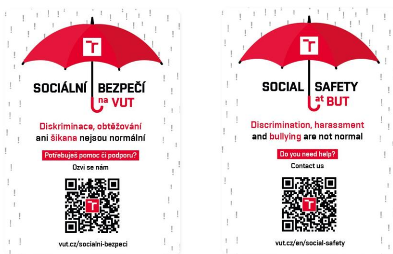
Samolepka, vizuál VUT

Cílem vzniku samolepky je efektivnější informování o podpoře sociálního bezpečí na VUT. QR kód uvedený na samolepce směřuje na web Sociálního bezpečí (českou nebo anglickou verzi). Samolepky lze nalézt na jednotlivých F/VÚ/S. Obvykle se jedná o místa pro setkávání studujících, studovny, relaxační místa pro studující i zaměstnance a další prostory (kuchyňky na kolejích, toalety, místa u skříněk, schránky důvěry, šatny CESA, studentské kluby atd.).