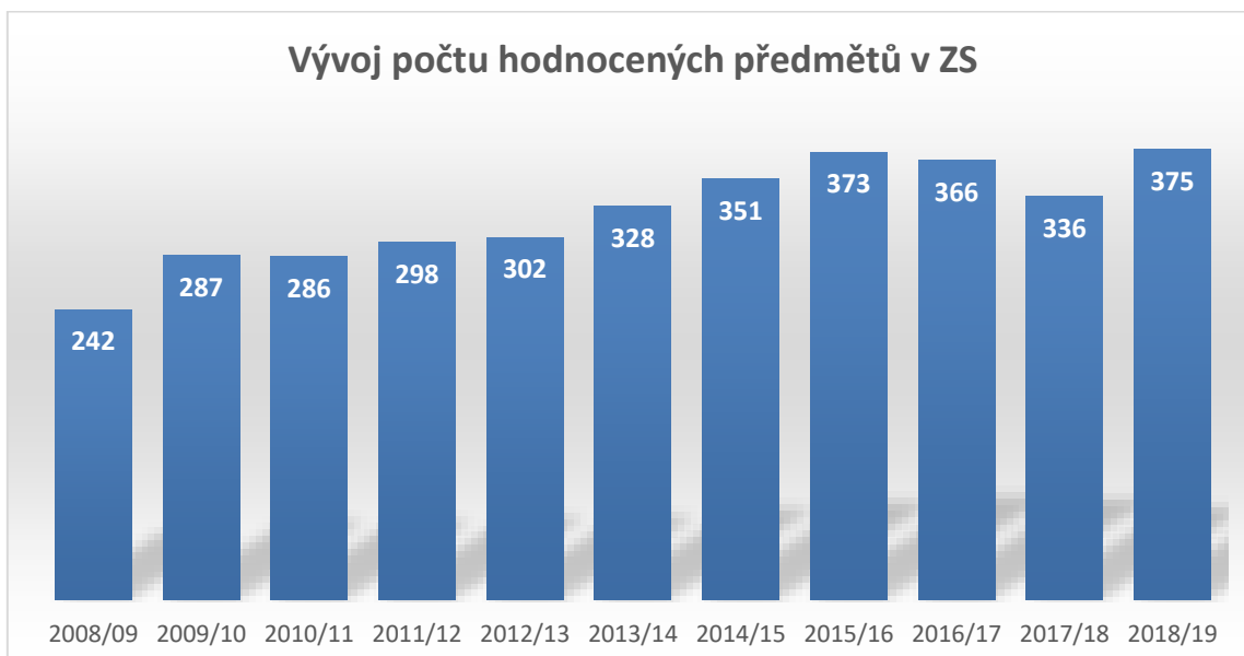
Vývoj počtu hodnocených předmětů v zimním semestru v jednotlivých akademických rocích (informace z IS VUT)

Z celkového počtu 716 (702) vyučujících bylo hodnoceno (tj. odpovězeno alespoň na jednu otázku) 711 (689) vyučujících, což je 99% (98%). Výše uvedenou podmínku pro zveřejnění výsledků splnilo 418 (377) hodnocených vyučujících, což je 58% (54%).